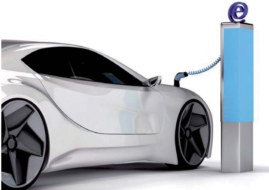
E-Autos sind auch steuerlich interessant